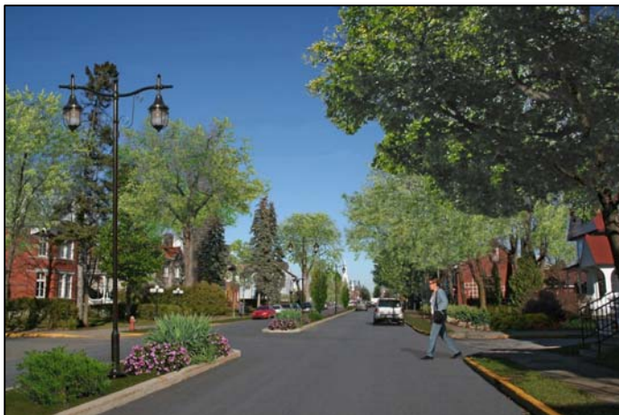
Le résultat final du réaménagement du boulevard Manseau va ressembler à ceci; le changement s'annonce magnifique.

Notons que l'aménagement paysager, au centre et sur les côtés du boulevard Manseau, devrait débuter avant l'arrivée des températures hivernales avec, notamment, la plantation d'une soixantaine d'arbres. Un système d'irrigation sera également enfoui pour s'assurer que les végétaux