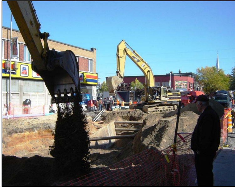
Cette photo prise fin septembre près de l'intersection du boulevard Manseau et de la Place Bourget montre bien que la mise en place des nouveaux réseaux d'aqueduc et d'égouts tire à sa fin.

En ce qui concerne les parties du boulevard Manseau comprises entre les rues Saint-Pierre et Beaudry et entre la Place Bourget et la rue Lajoie, le remplacement des anciennes canalisations d'aqueduc et d'égout, vieilles d'au moins 70 ans, se poursuit. Lorsque les nouveaux tuyaux auront été enfouis, les bordures seront coulées et ces deux sections du boulevard seront à leur tour asphaltées. Selon l'échéancier en vigueur, les travaux se termineront vers la fin du mois d'octobre. La deuxième couche d'asphalte sera appliquée, quant à elle, en 2008.