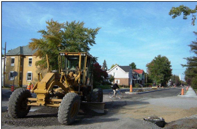
Une première couche d'asphalte sera bientôt posée entre les rues Saint-Pierre et Lajoie.

Toutes ces étapes ont déjà été réalisées entre les rues Saint-Pierre et Lajoie, ce qui a permis de procéder à la confection des bordures de béton. Si le temps demeure clément et s'il n'y a pas trop d'imprévus, une première couche d'asphalte sera bientôt appliquée dans la partie où les travaux sont déjà complétés.